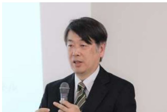
永江教授による講演

その後、理学研究科セミナーハウスにおいて、理学研究科基金奨学金受給者によるポスター発表と茶話会を開き、後援者の皆様と交流を図りました。