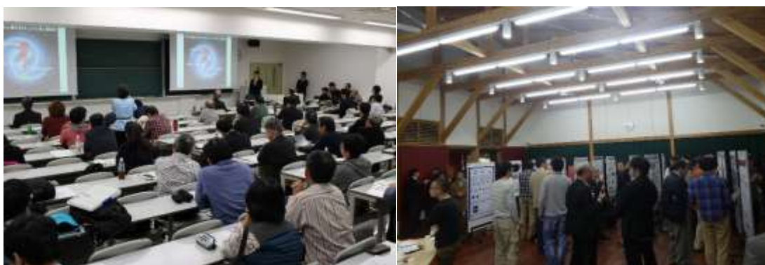
理学研究科基金奨学金受給者による成果発表とポスター発表